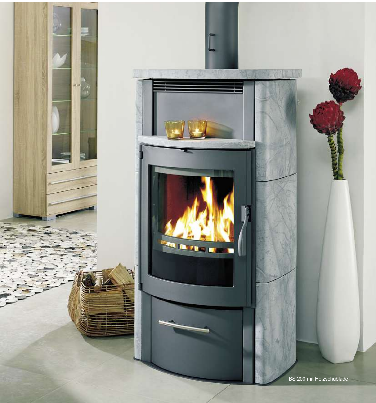
BS 200 mit Holzschublade